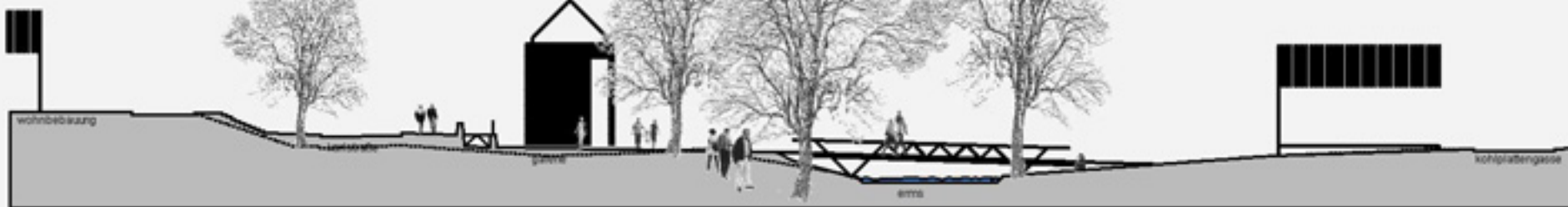
schnitt beim steg m 1:200